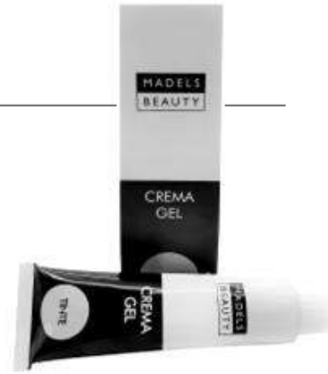
TINTE EN CREMA GEL