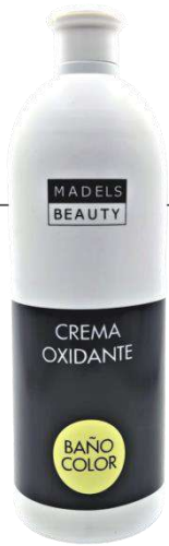
EMULSIÓN OXIGENADA BAÑO DE COLOR 10Vol