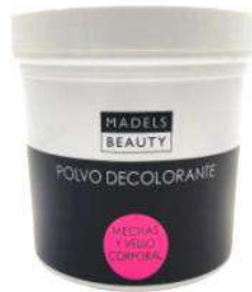
POLVO DECOLORANTE AZUL 500grs / INDIVIDUAL