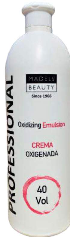
CREMAS OXIGENADAS 20Vol , 30Vol y 40 Vol 1000ML / Individual